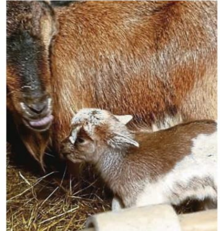
Wurde Anfang März geboren: Das erste der Zwergziegenlämmer ist da.