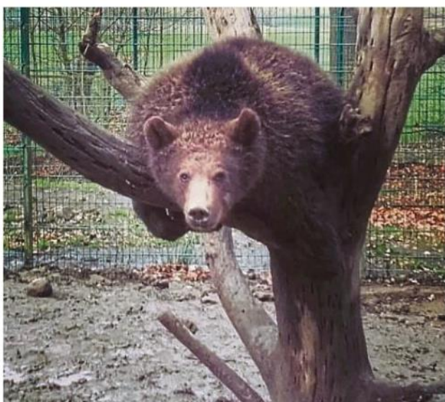
„Da ihr uns im Moment nicht persönlich besuchen könnt, schicken wir jeden Tag ein Foto an euch raus“: Mit dieser Botschaft grüßt der Jungbär bei Facebook.

sehen, weil wir die Einfas- sung des Bärenteichs restau- rieren.“ Bis der Park wieder öffnen darf, wird es täglich ei- nen Fotograuß von den Tieren dort auf der Facebookseite des Wildparks geben.