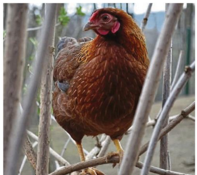
In den kommenden Tagen erwarten wir auch wieder die ersten frischgeschlüpften Küken: Virtuelle Grüße gibt es auch von den Hühnern aus dem Frühlingshof.